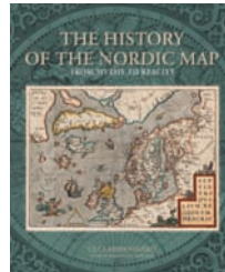
THE HISTORY OF THE NORDIC MAP From Myth to Reality

The extensive research of the Scandinavian cartography. The book is an inexhaustible reference book and an excellent gift. 375 pages.