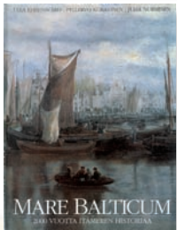
MARE BALTICUM 2000 vuotta Itämeren historiaa

Itämeren kohtalot kahden vuosituhannen ajalta. Suomen kirjataiteen komitea palkitsi teoksen vuoden 1995 kauneimpana kirjana. 288 sivua. Suomi, englanti.