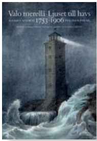
VALO MERELLÄ - LJUSET TILL HAVS Suomen majakat - Finlands fyrar 1753-1906