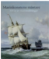
MARINKONSTENS MÄSTARE 400 år av marinnålningar

Boken presenterar Europas mest uppskattade konstnärers marinnålningar från 1600-talet till 1900-talet. I boken finns över 200 färgbilder med skepps- och havsmotiv. 326 sidor.