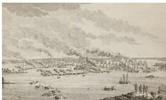
Korkeussaaren taistelu 15. elokuuta 1789.

museoista ja arkistoista. Pikkutarkat alusten pienoismallit, loisteliaat maalaukset ja käsintehdyt kartat muodostavat teoksen kuvituksen. Pietarin merimuseo osoittautui varsinaiseksi aarraitaksi kuvitusta etsittäessä. Museon kokoelmiin kuuluu 700 000 esinettä. Säätiön väki pääsi tutustumaan ainutlaatuisiin aarteisiin museon ammattitaitoisen henkilökunnan opastuksella toukokuussa.