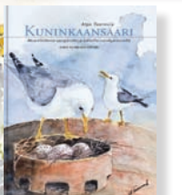
KUNINKAANSAARI Akvarellinkeveä saaripäiväkirja kolmelta vuosikymmeneltä

Tuurnalan perheen mökkielämää paratiisinaisessa linnoitusaaressa Helsingin edustalla. Erinomainen lahjakirja. 128 sivua.