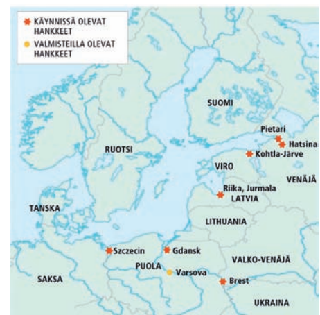
John Nurmisen Säätiön rehevöitymishankkeiden kohdekaupungit.

tuneesti testattu aluksen reittisuunnitelman lähettämistä tankkerilta maihin viranomaisille. Kevään ja kesän aikana tullaan keskittymään viranomaisilta aluksille toimitettavan navigointi-informaation sisältöön.