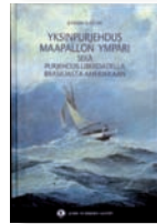
YKSINPURJEHDUS MAAPALLON YMPÄRI sekä purjehdus Liberdadella Brasiliasta Amerikkaan

Joshua Slocumin tarina on merikirjallisuuden ja matkakertomusten klassikko. 256 sivua.