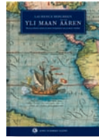
YLI MAAN ÄÄREN Magalhãesin kohtalokas purjehdus maailman ympäri

Jännittävä ja traaginen kertomus ensimmäisestä maailmanympäripurjehduksesta. 354 sivua.