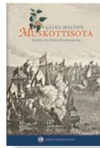
MUSKOTTISOTA Taistelu Itä-Intian Maustesaarista

Hyvä sekoitus loistavaa tarinan kerrontaa ja oikeaa historiaa unohtetusta kauppasodasta, joka käytiin Maustesaarilla 1600-luvulla. 312 sivua.