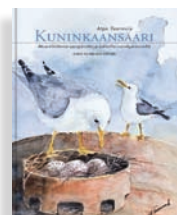
KUNINKAANSAARI Akvarellinkeveä saaripäiväkirja kolmelta vuosikymmeneltä

Tuurnalan perheen mökkielämää paratiisinomaisessa linnoussaareissa Helsingin edustalla. Erinomainen lahjakirja. 128 sivua. Suomi.