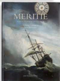
MERITIE Navigoinnin historia

Kansainvälisesti menestynyt Meritie on silmiä hivelevä arvoteles merten, laivojen ja navigoinnin historiasta kaikille merenkulusta kiinnostuneille. 374 sivua. Suomi, englantti, saksa, ranska, portugali, espanja.