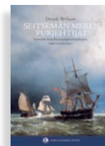
SEITSEMÄN MEREN PURJEHTIJAT Suurten maailmanympärimatkojen viisi vuosisataa

Huikkeitä purjehdusmatkoja ja seikkailuja maailman ympäri Magalhãesista nykypäivään. 352 sivua. Suomi.