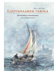
LUOTSISAAREN TARINA Merimatkoja menneeseen

Tuurnalan taidokas kynä ja herkkä sivellin ovat tavoittaneet elävästi ja raikkaasti kadonneen luotsihistorian maailman. 112 sivua. Suomi.