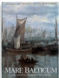
MARE BALTICUM 2000 vuotta Itämeren historiaa

Itämeren kohtalot kahden vuosituhannen ajalta. Suomen kirjataiteen komitea palkitsi teoksen vuoden 1995 kauneimpana kirjana. 288 sivua. Suomi, englantti, saksa, venäjä (Балтийское море).