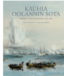
KAUHIA OOLANNIN SOTA Krimin sota Suomessa 1854-1855