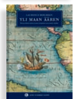
YLI MAAN ÄÄREN Magalhãesin kohtalokas purjehdus maailman ympäri