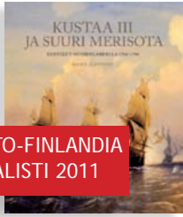
KUSTAA III JA SUURI MERISOTA Taistelut Suomenlahdella 1788-1790

Loistelia luku- ja katselukokemus Ruotsin ja Venäjän välisestä pohjois-Itämeren herruudesta, jonka kuluessa käytiin Suomenlahdella ennen näkemättömän suuria meritaisteluja. 352 sivua. Suomi.