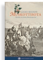
MUSKOTTISOTA Taistelu Itä-Intian Maustesaarista