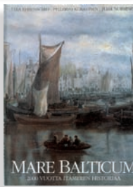
MARE BALTICUM 2000 vuotta Itämeren historiaa

Itämeren kohtalot kahden vuosituhannen ajalta. Suomen kirjataiteen komitea palkitsi teoksen vuoden 1995 kauneimpana kirjana. 288 sivua. Suomi, englantti, saksa, venäjä ( Балтийское море ).