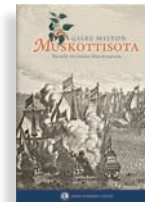
MUSKOTTISOTA Taistelu Itä-Intian Maustesaarista