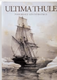
ULTIMA THULE Pohjoiset löytöretket

Teos pohjoisen kartografian ja navigoinnin historiasta. Kirja sai Suomen kirjataiteen komitean kunniamaininnan vuonna 2001.