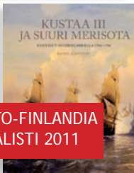
KUSTAA III JA SUURI MERISOTA Taistelut Suomenlahdella 1788-1790

Loistelas luku- ja katselukokemus Ruotsin ja Venäjän välisestä sodasta, jonka kuluessa käytiin Suomenlahdella ennennäkemättömän suuria meritaisteluja. 352 sivua. Suomi.