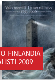
VALO MERELLÄ - LJUSET TILL HAVS Suomen majakat - Finlands fyrar 1753-1906