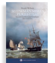
SEITSEMÄN MEREN PURJEHTIJAT Suurten maailmanympärimatkojen viisi vuosisataa

Huikkeitä purjehdusmatkoja ja seikkailuja maailman ympäri Magalhãesista nykypäivään. 352 sivua. Suomi.