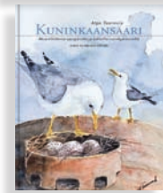
KUNINKAANSAARI Akvarellinkeveä saaripäiväkirja kolmelta vuosikymmeneltä