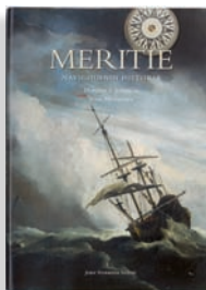
MERTIE Navigoinnin historia

Kansainvälisesti menestynyt Meritie on silmiä hivelevä arvoteles merten, laivojen ja navigoinnin historiasta kaikille merenkulusta kiinnostuneille. 374 sivua. Suomi, englantti, saksa, ranska, portugali, espanja.