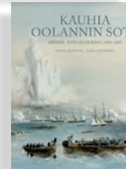
KAUHIA OOLANNIN SOTA Krimin sota Suomessa 1854-1855