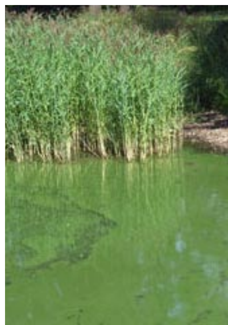
Sinilevää Taivallahden rannalla 18.7.2005.

Oma verkkokauppa -alustan meille lahjoitti tampereläinen Vilkas Group Oy.