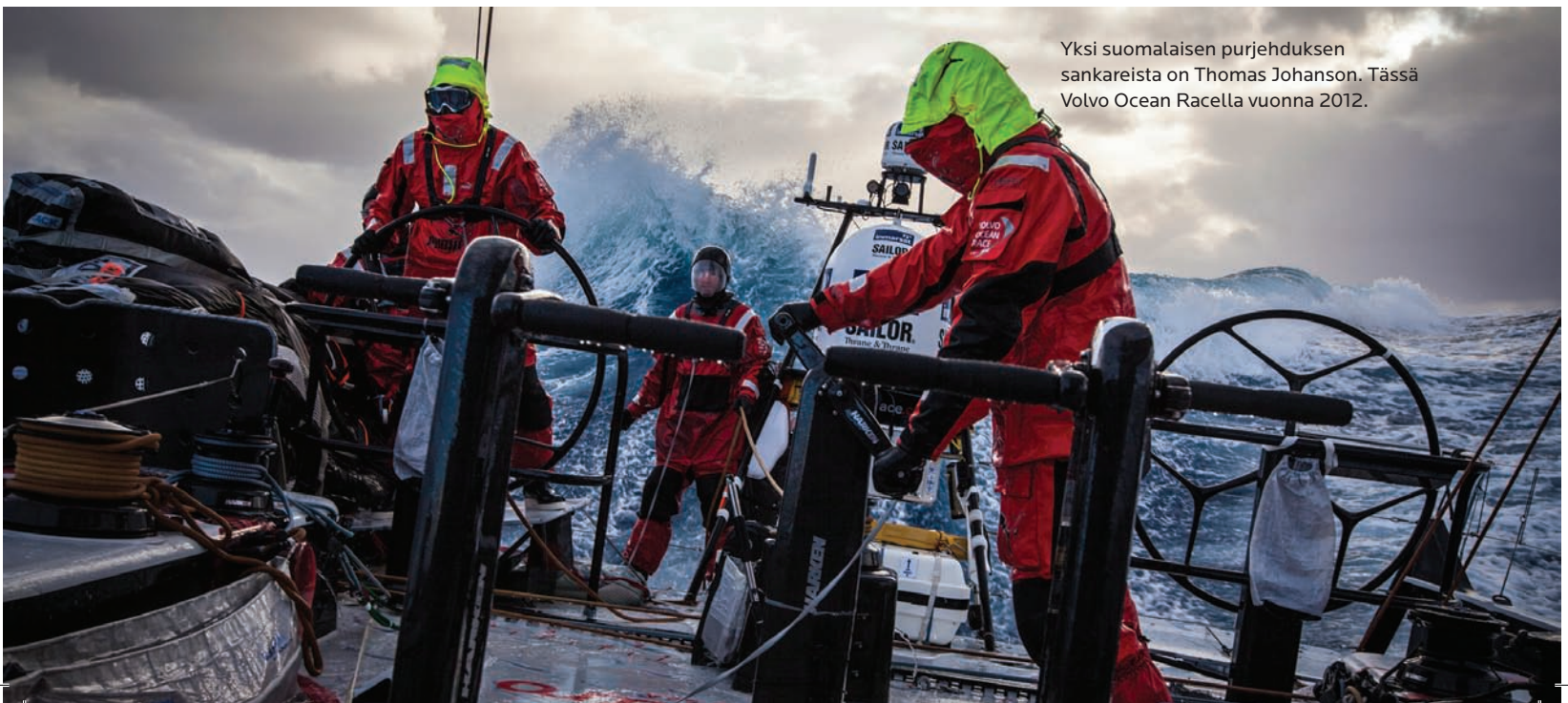
Yksi suomalaisen purjehduksen sankareista on Thomas Johanson. Tässä Volvo Ocean Racella vuonna 2012.