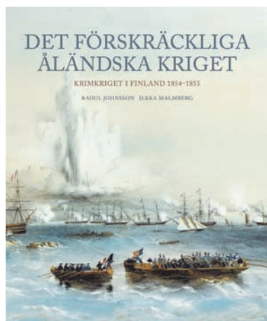
nyt ruotsiksi! DET FÖRSKRÄCKLIGA ÄLÄNDSKA KRIGET KRIMKRIGET IN FINLAND 1854-1855