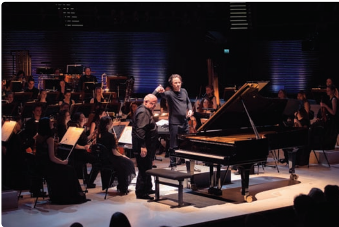
Konsertin solistina nähtiin georgialainen Aleksander Toradze, joka johdatti kuulijakunnan Sergei Prokofievin pianokonserton säveliin.

Järvi hurmasi konserttiyleisön elävällällä ja vauhdikkaalla esiintymisellään. Kapellimestari ohjasi konsertin lopuksi myös yleisön mukaan musiikilliseen ilonpitoon kannustamalla ihmisiä taputtamaan soitannan tahtiin. Konserttiohjelman päätteeksi kuultiin lisäksi Järven pitämä koskettava puhe, jossa hän pohti Itämeren merkitystä ja sen suojelun tärkeyttä.